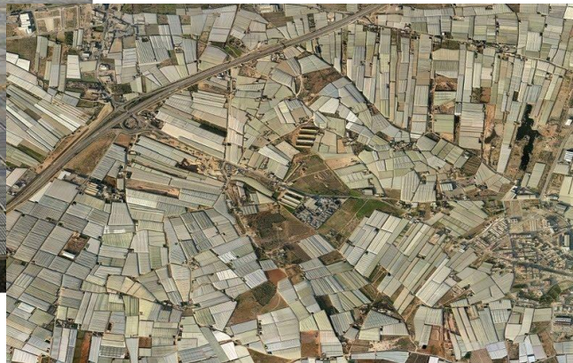
گلخانه‌های آلمریا با تولید سالانه ۲,۵ میلیارد دلار

روش‌های مختلف هیدروپونیک مورد استفاده در این گلخانه‌ها باعث تولید میوه و سبزیجات با مقدار آب کم شده است. حدود ۸ درصد این گلخانه‌ها هیدروپونیک بوده که ۵۴ درصد از کل صنعت هیدروپونیک در اسپانیا را شامل می‌شود. در حال حاضر بیشترین بستر کشت مورد استفاده در گلخانه‌های این منطقه پرلیت می‌باشد. پرلیت مورد استفاده در باغبانی (شکل ۴) از سرد شدن سریع مواد مذاب آتشفشانی ریولیتی با دمای حدود ۹۰۰ درجه سانتی‌گراد حین تماس با آب سرد تشکیل می‌شود. تحت این شرایط آب مولکولی این مواد بخار شده و سطح ذرات آن به بیرون پف کرده و حجم آن بیش از ۱۳ برابر افزایش می‌یابد. پرلیت حاصل بسیار سبک، استریل و سفید رنگ می‌باشد که به دلیل داشتن سطح وسیع، قابلیت نگهداری آب ۳ تا ۷ برابر وزن خودش دارد.