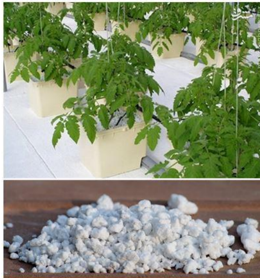
شکل ۴- تصویر بالا: گیاه کشت شده در پرلیت

همچنین، به دلیل سبکی زیاد آن امکان نفوذ و رشد ریشه در پرلیت مطلوب می‌باشد. پرلیت پی اچ خنثی داشته در قلیایت یا اسیدیته محیط کشت تغییری ایجاد نمی‌کند. خصوصیات مطلوب پرلیت باعث شده تا در بیشتر کشت‌های هیدروپونیک از این بستر کشت استفاده شود