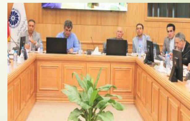
اتاق بازرگانی، صنایع، معادن و کشاورزی خراسان رضوی